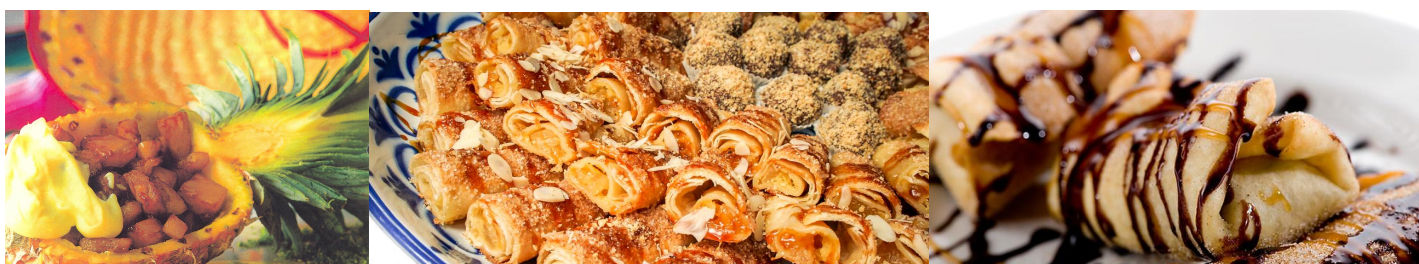
ŠMORN, GIBANICA, ŠTRUKLJI Z OREHI IN ZAVITKI